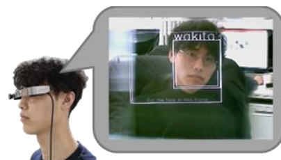
目の前の人の名前が分かる人物認識ウェアラブルシステム