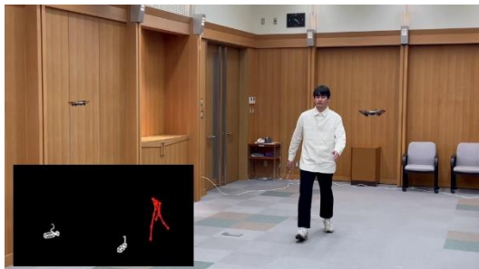
複数台の人物自動追従ドローンによるモーションキャプチャ