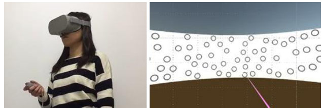
心の健康状態を推定できる VR ゲーム